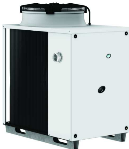
Bomba de calor a gas